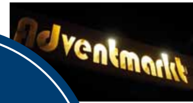
>> Adventmarkt als neue Allander Kostbarkeit.