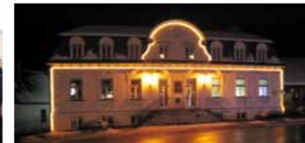
>> Besucherzentrum Mayerling als Impuls für die gesamte Region.