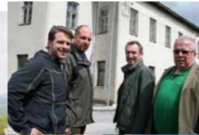
>> Neues Leben im Riedlinghaus.