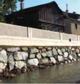
>> Wir sorgen für mehr Sicherheit!