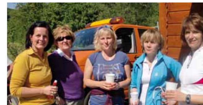
>> Erlebnisradwege für Sport und Erholung.