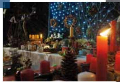
>> Traditionelle und neue Veranstaltungen führen durch den Jahreskreis.