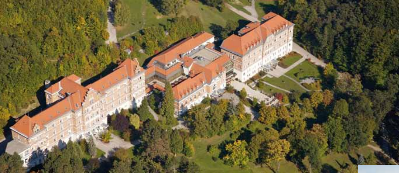
>> Wir wollen Alland zum Zentrum des Wienerwaldes machen.