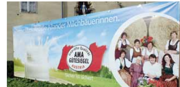
>> Stolz auf Alland und seine natürlichen Produkte sind nicht nur unsere Bäuerinnen.