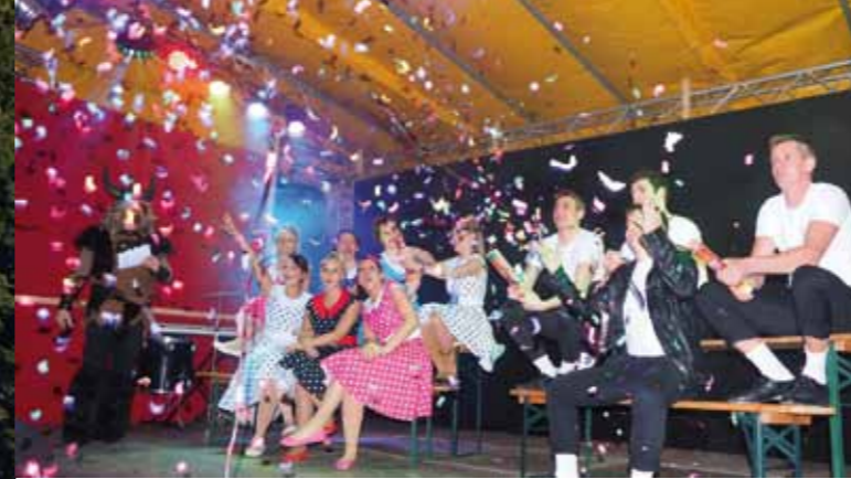
>> Faschingsausklang und mehr in Gemeinschaft erleben.