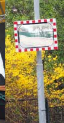
>> Ambitionierte Projekte für mehr Bürgerkomfort.