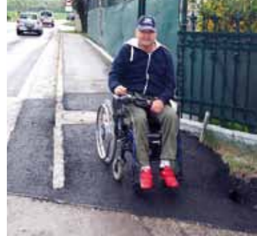
>> Maßgeschneiderte Gehwege und Übergänge.