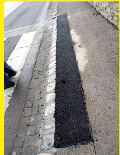
>> Kleine Maßnahmen mit großer Wirkung: Gehsteige wurden abgeschragt.