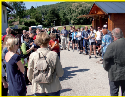
>> Ambitionierte Projekte sorgen für mehr Sicherheit und Bürgerkomfort!