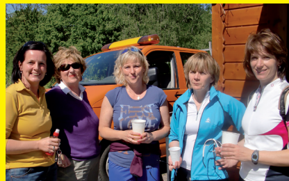
>> Gemeinde ist Gemeinschaft.