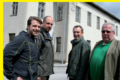
>> Lebensmittelmarkt entsteht.

>> Im Vorwort unseres Bürgermeisters werden die aktuellen Strukturverbesserungen im Gemeindegebiet aufgezeigt: Ein neuer Radweg, Maßnahmen zum Allander Hochwasserschutz und die barrierefreie Gestaltung unserer Gehwege. Viele weitere Vorhaben bringen Alland vorwärts und machen die Gemeinde zur Wohlfühlmetropole!